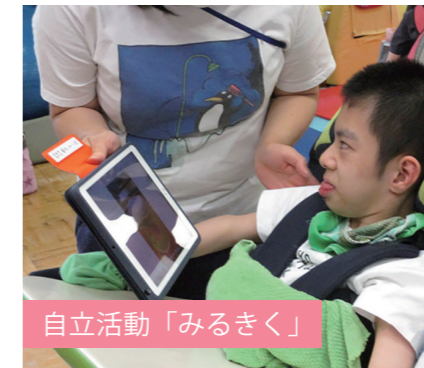
自立活動「みるきく」